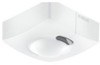
Bevegelsessensor HF 3360 COM1