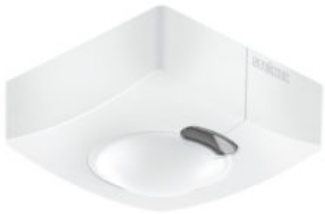
Bevegelsessensor HF 3360 Potentialfri