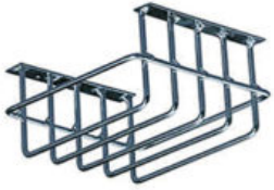
Beskyttelsesgitter tak - vegg