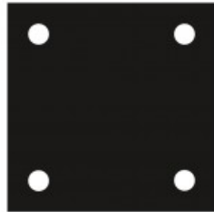
Dampspærre for Ørstafundament c/c 240 mm