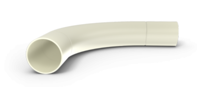
Rørbend PVC 40 mm BG