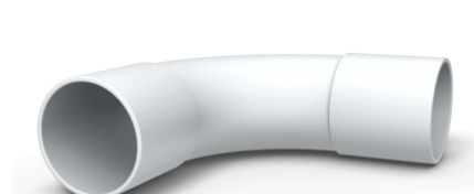
Rørbend 40 mm WT