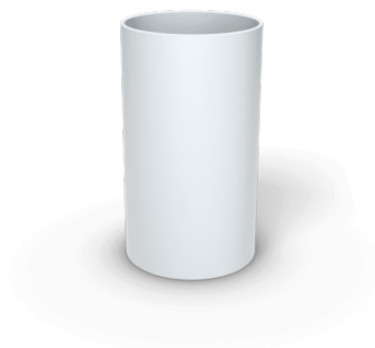
Skjøtemuffe 40 mm WT