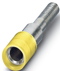
Prøvestikkerbøssing, farge: gul

Angitte spesifikasjoner er hentet fra onlinekatalogen. Du finner komplett informasjon og spesifikasjoner i brukerdokumentasjonen. De generelle bruksvilkårene for nedlastinger fra Internett gjelder. ( http://phoenixcontact.no/download )