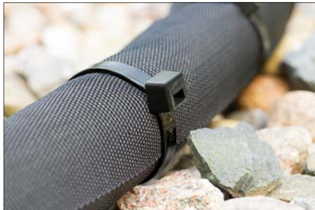
T-serien i slagfast materiale (PA66HIR(S)).