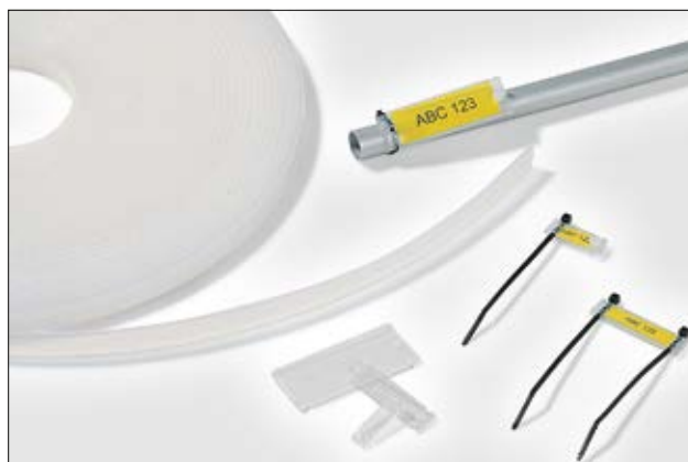
Helafix HC og HCR skiltprofil; multifunksjonell merking.