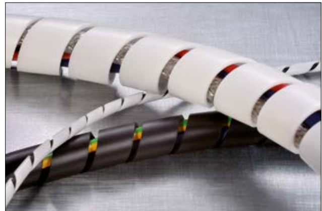
Spiralslange SBPEFR leveres i mange størrelser, i fargene sort og hvit.