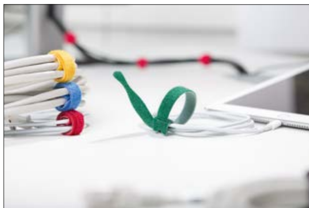
Takket være det presise designet, løsner ikke TEXTIE fra kabelbunten.