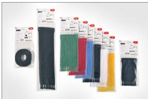
Serie TEXTIE er tilgjengelig i flere farger og lengder.