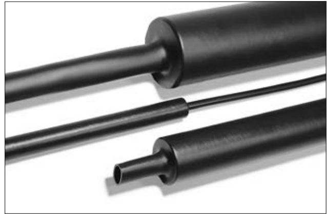
Medium tykkvegget krympeslange MA47 med lim og krympeforhold 4:1.