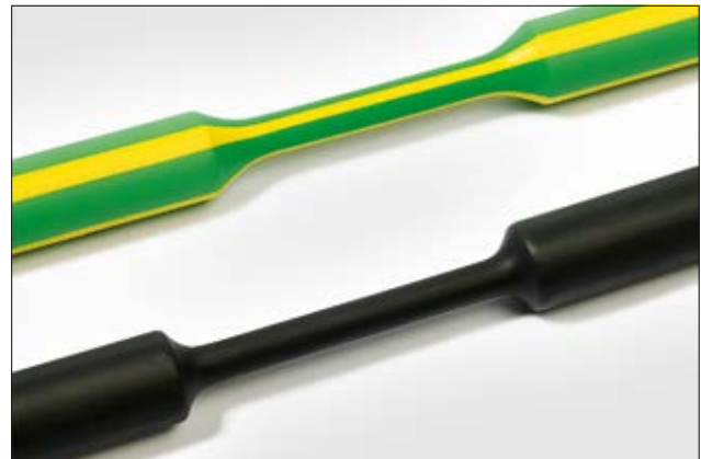
TREDUX krymper 3:1.