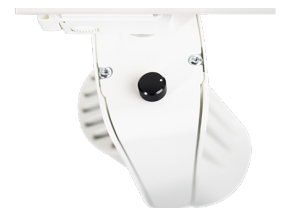
S70 MIDI HDdi POT