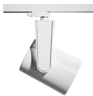
Full fleksibilitet til å vippe og rotere lysretning