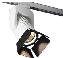
S70 med tilbehør avblendingsklaffer