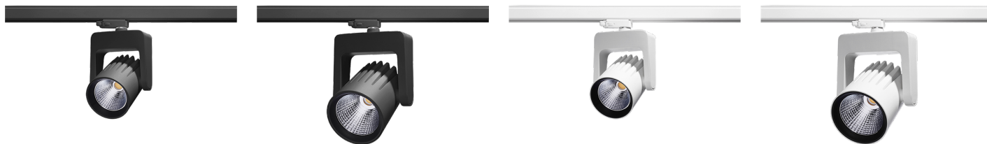
S70 MIDI SVART