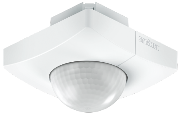
IS 3360 MX HIGHBAY PF UP