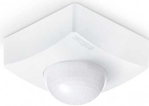
IS 3360 MX HIGHBAY LEVELINK