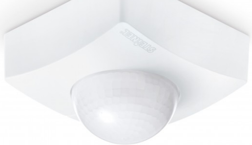
IS 3360 MX HIGHBAY COM1 AP