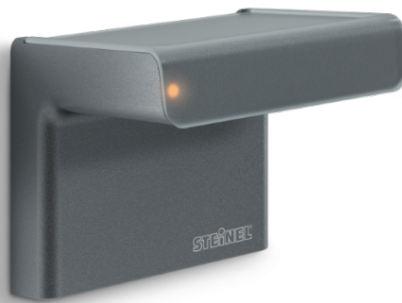
IHF 3D KNX ANTRASITT