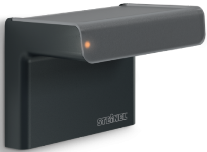
IHF 3D KNX SORT