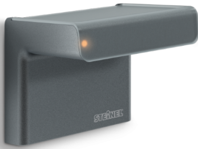
IHF 3D KNX ANTRASITT