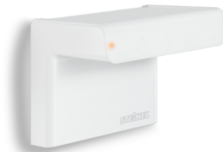
IHF 3D KNX HVIT