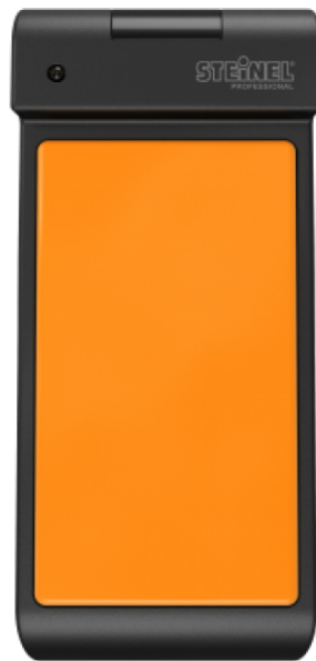
SMART REMOTE CONTROL