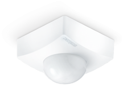
IS 345 MX HIGHBAY LEVELINK