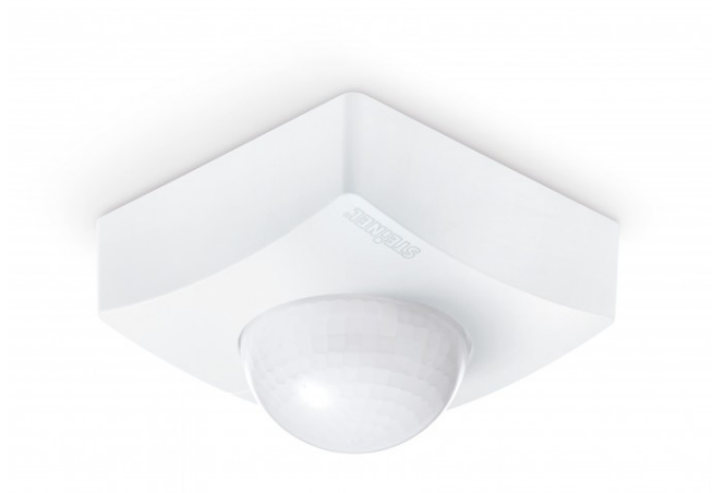
IS 3360 MX HIGHBAY PF AP