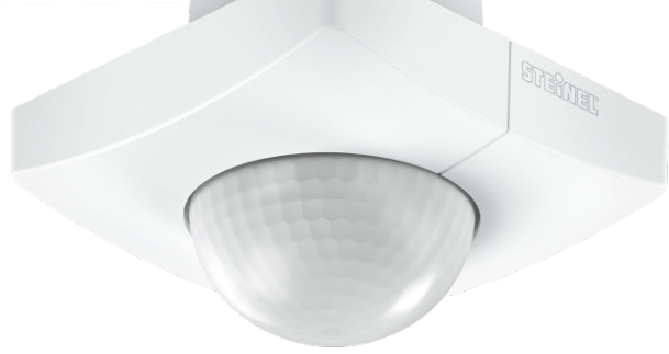
IS 3360 MX HIGHBAY PF UP