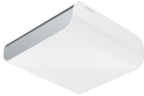
RS LED M2 SØLV