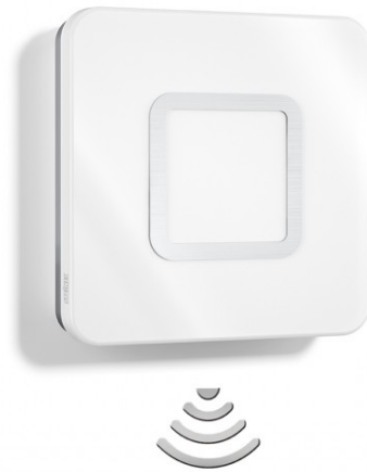
RS LED M1 RUSTFRITT STÅL