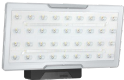
Sensor LED Strahler XLED PRO Wide SL