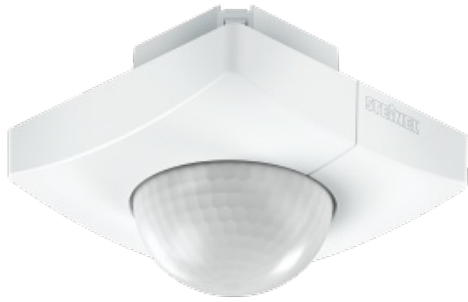
IS 3360 MX Highbay

Tilbehør: Fjernkontroll RC8 eller Smart Remote