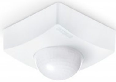
IS 3360 MX Highbay