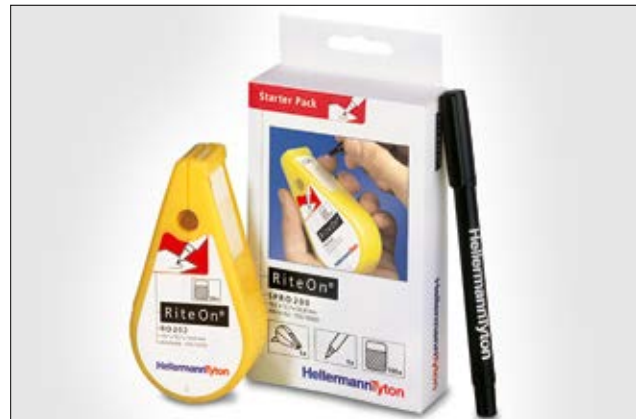
Med RiteOn startpakke har du det du trenger til merkejobben.

Senere kan refillpakker og merkepenner kjøpes separat for komplettering ved behov.