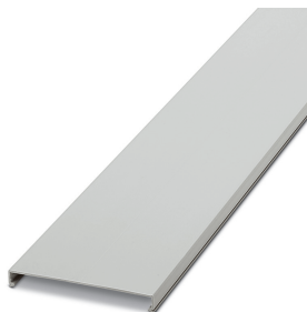
Deksel til kabelkanal, lysegrått, halogenfritt, bredde 120 mm, lengde 2000 mm

Angitte spesifikasjoner er hentet fra onlinekatalogen. Du finner komplett informasjon og spesifikasjoner i brukerdokumentasjonen. De generelle bruksvilkårene for nedlastinger fra Internett gjelder. ( http://phoenixcontact.no/download )