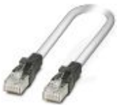
Patchkabel, CAT5, prefabrikkert, 5 m

Patchkabel - FL CAT5 PATCH 5,0 - 2832580