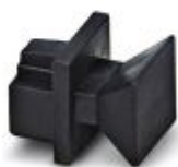
Støvbeskyttelseshetter for RJ45-bøsning

Støvbeskyttelse - FL RJ45 PROTECT CAP - 2832991