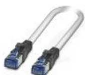
Patchkabel, CAT6, prefabrikkert, 12,5 m

Patchkabel - FL CAT6 PATCH 12,5 - 2891369