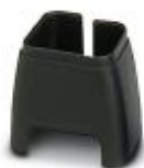
Fargemerking for patchkabel, svart

Fargemerking - FL PATCH CCODE BK - 2891194