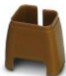
Fargemerking for patchkabel, brun

Fargemerking - FL PATCH CCODE BN - 2891495