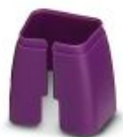
Fargemerking for patchkabel, fiolett

Fargemerking - FL PATCH CCODE VT - 2891990