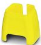
Fargemerking for patchkabel, gul

Fargemerking - FL PATCH CCODE YE - 2891592