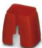
Fargemerking for patchkabel, rød

Fargemerking - FL PATCH CCODE RD - 2891893