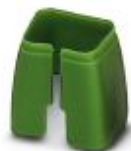
Fargemerking for patchkabel, grønn

Fargemerking - FL PATCH CCODE GN - 2891796