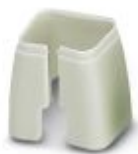
Fargemerking for patchkabel, grå

Fargemerking - FL PATCH CCODE GY - 2891699