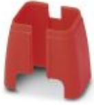
Securityelement for FL patchkabel

Port Guard Security-element - FL PATCH SAFE CLIP - 2891246