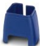
Fargemerking for patchkabel, blå

Fargemerking - FL PATCH CCODE BU - 2891291