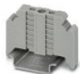
Endeholder, bredde: 9,5 mm, farge: Grå