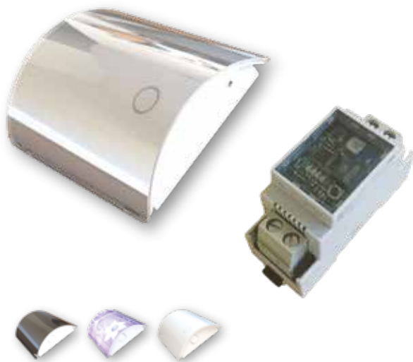
Skins gir valgfritt design/farge