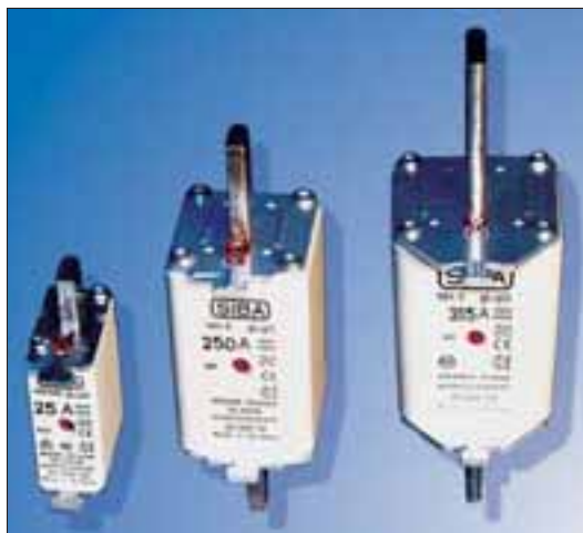
NH sikringer standard design, str. 000 - 0 og 3.