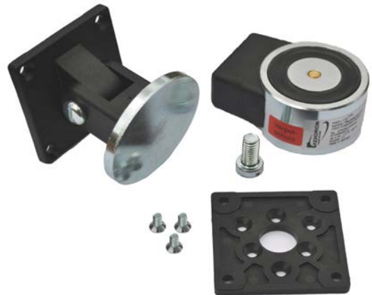
E6300011 CQ Komplet