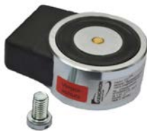
E6300009 CQ M8