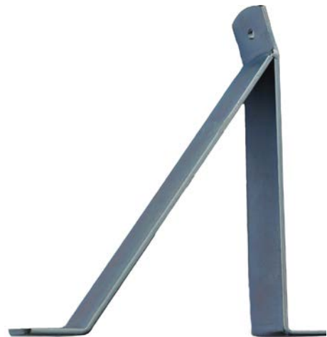
E6300008 CQ Vinkelfästa

CQ Vægffäste för svängdörr. 230mm hög, 180mm bred. Fastsättning i vägg 2st M10. Vinkelfäste som används med CQ Safe M8 alt.CQ Komplet. OBS använd den M8 skruv som medföljer magnetleverans för att inte påverka centrumtapp. Gängning i magnet max.8mm.