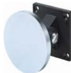
E6306194 (Flexibelt ankare ingår)